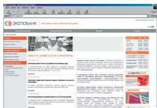
Сайт Интернета .....