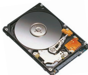
Жесткий диск .....